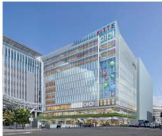
「博多マルイ」が出店させていただく 「KITTE博多」完成予定図。